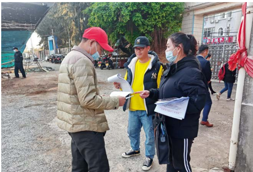
2021 年 1 月 25 日,区科技工信局工作人员到海兴船厂开展安全检查。