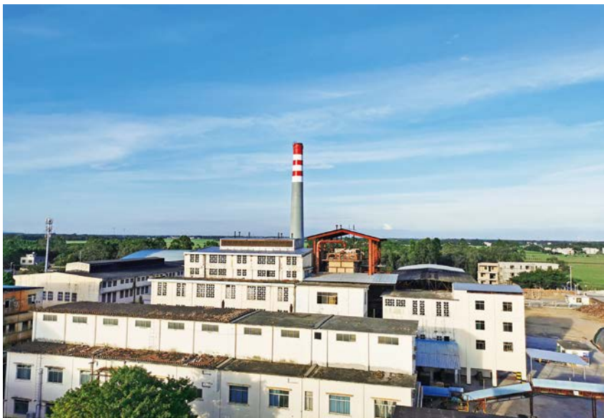
2021年,星星制糖有限公司一角。